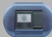
GREEN SWITCH Detector de presencia con sensor crepuscular y temporización del apagado, efectivo ahorro de energía