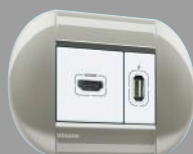
Tomas para señales diversas, VGA, USB, HDMI, RCA, acorde a las necesidades modernas.