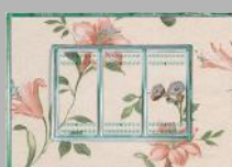
PLACA LIVING-LIGHT KRISTAL TRANSPARENTE Personalización sin límites